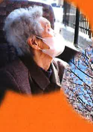
花咲スポーツ公園