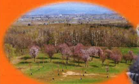
鷹栖 パレットヒルズ

担当職員が見頃の桜を探し、日によって場所を変えてのドライブとなりました。 悪天候の中でのドライブとなった曜日もありましたが、皆さんでお喋りをしながら ドライブをすることで、少しでも気分転換になっていれば幸いです♪