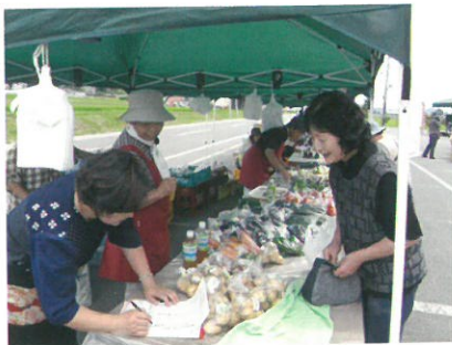
毎年好評!!野菜と加工品販売