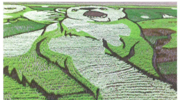
田んぼアート（JAたいせつ青年部）