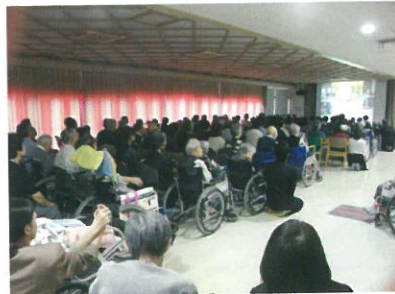
スライドで一年をふりかえりました