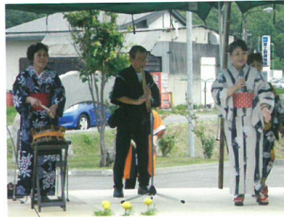
たいせつ民謡クラブさんの民謡と盆踊りを、毎年楽しみにしています