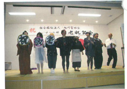
職員の余興に大笑い