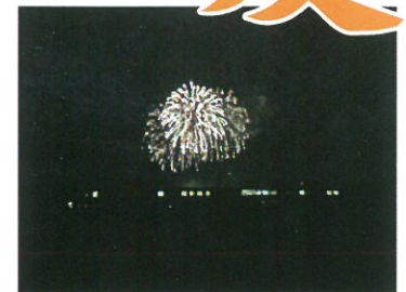
施設の後方に打ち上がる花火