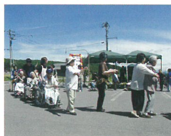
民謡の生演奏に合わせて盆踊り (焼肉&夏まつり)