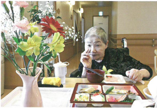
お祝い膳に舌鼓 そのお味は…ピースV