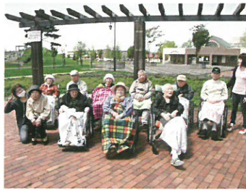
永山中央公園散策 (入居)