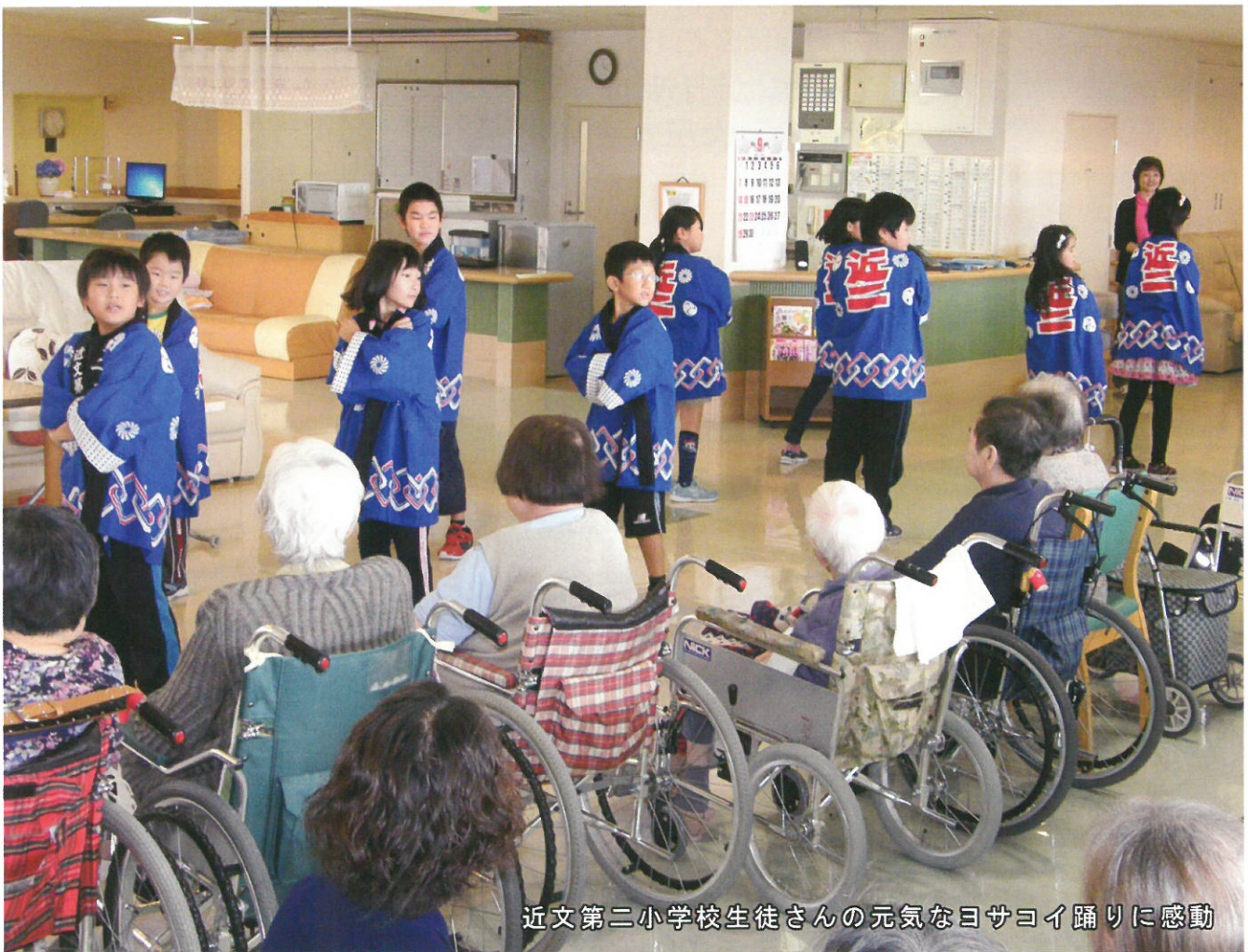
近文第二小学校生徒さんの元気なヨサヨイ踊りに感動