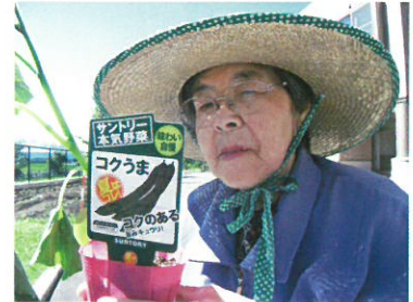
野菜の苗定植 (入居)