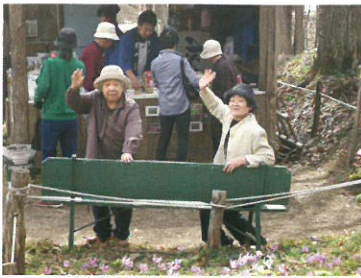
カタクリの花観賞 (入居)