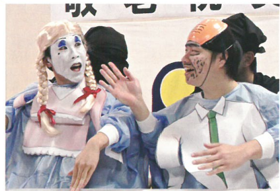
余興 そのメイクに思わず「ダメよ～ダメダメ」