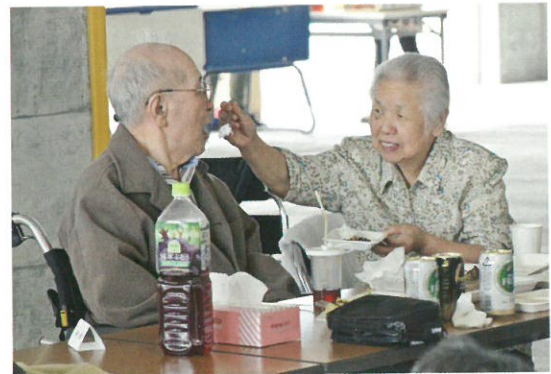
「肉」も「気温」も「ご夫婦の仲」も「あつつあつ、