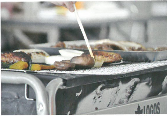
炭火に炙られた肉の香が食欲をそそります