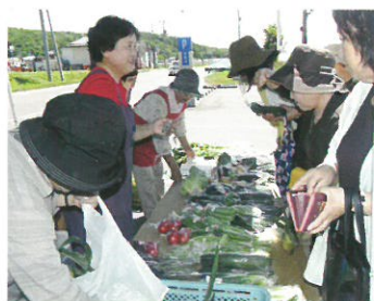
大人気!! 野菜・加工品即売会 (焼肉&夏まつり)