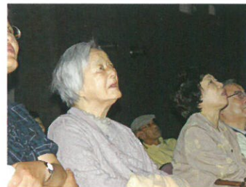
七夕のタベ 花火を見上げて (入居)