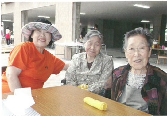
焼けるまでもう少し… 首を伸ばしてハイ、チーズ!