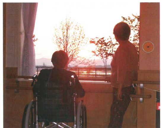
水田に映る夕陽に明日想う