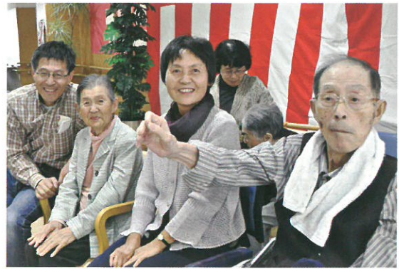
これからもますますお元気で！