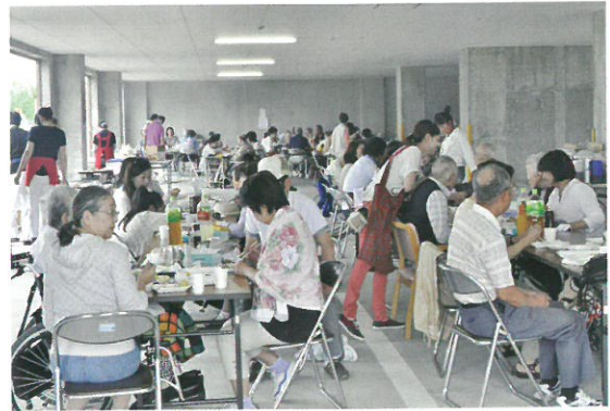
昨年を上回るご参加ありがとうございます