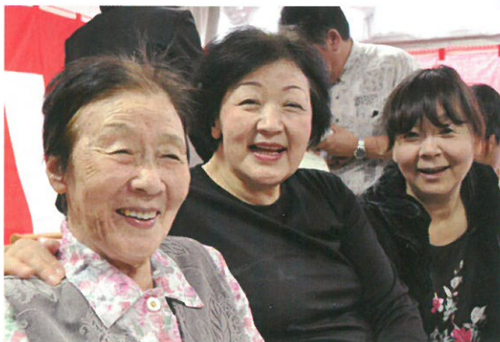
ご家族と笑顔で迎える敬老の日