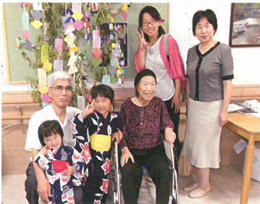
七夕飾り 願うは家族の幸せ (入居)