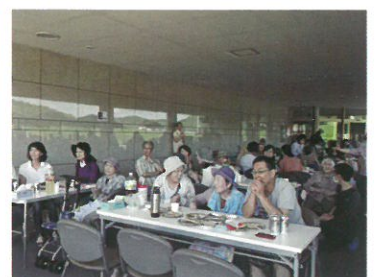
お腹も満腹、余興を楽しむ皆さん (焼肉&夏まつり)