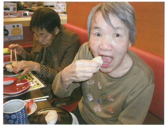
外食 回転寿司「やすけ」 (入居)