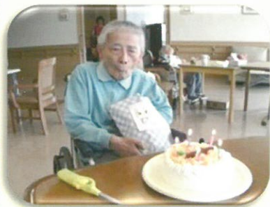
お誕生日のケーキは 職員の手作りです。