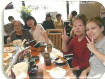
回転寿司へ行きました。 デザートも忘れずに注文!!