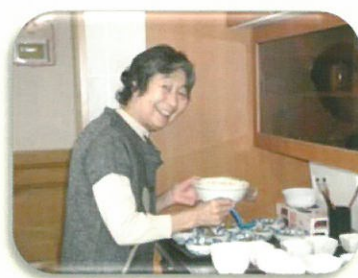
風のまちでは、ご利用者の できることを大切にして、楽 しく過ごして頂けるように心 掛けています。