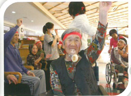
秋の運動会で パン食い競争！