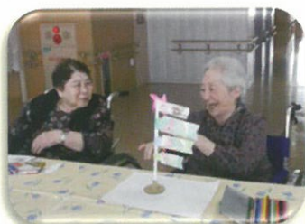
端午の節句には、 鯉のぼりを作りました。