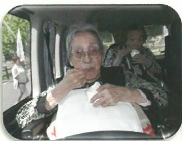
ドライブにはソフトクリーム！