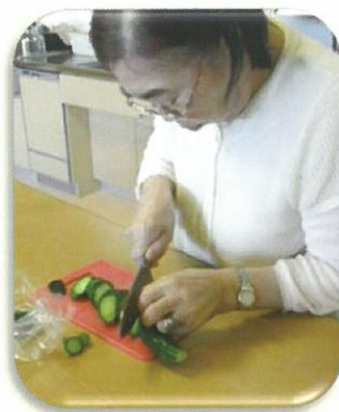
さすがの包丁さばき！ 美味しい漬物になりました。