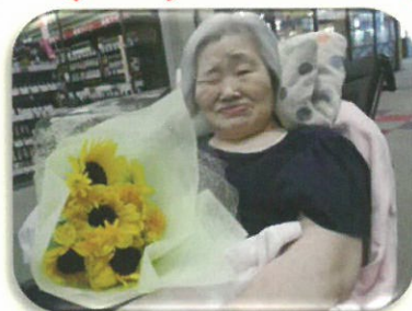
外食レクリエーションは回転ずしが人気です。 帰りには花屋で綺麗な花を買って帰りました。