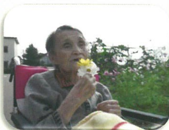
お花が綺麗な季節となり、散歩の機会も増えました