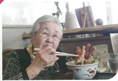
みんなで外食です！