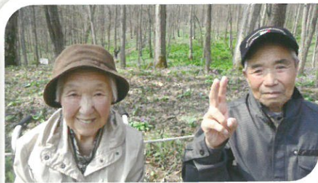
突哨山のカタクリは 最高！