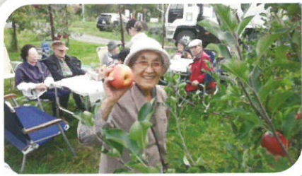
大人気のりんご祭り！