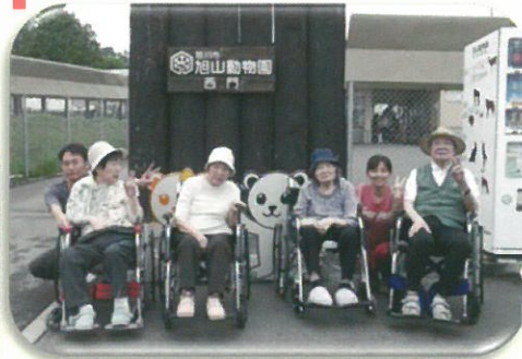
7月には旭山動物園へ行きました!!