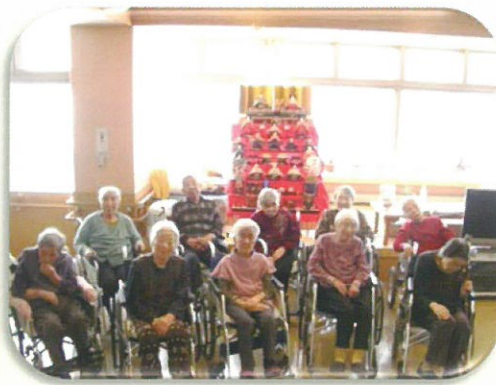
星のまちではこれからも、 皆様とたくさんの思い出を作り、 共有していきたいと思ひます。