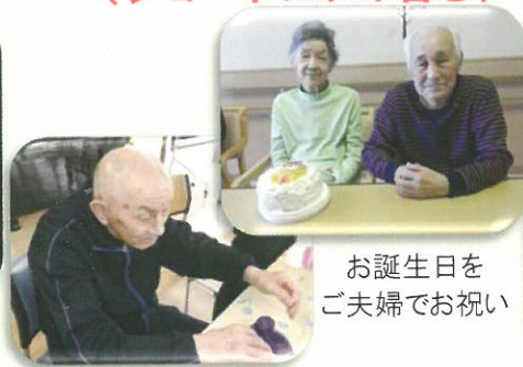
お誕生日を ご夫婦でお祝い