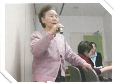
数字合わせも人気上昇中！