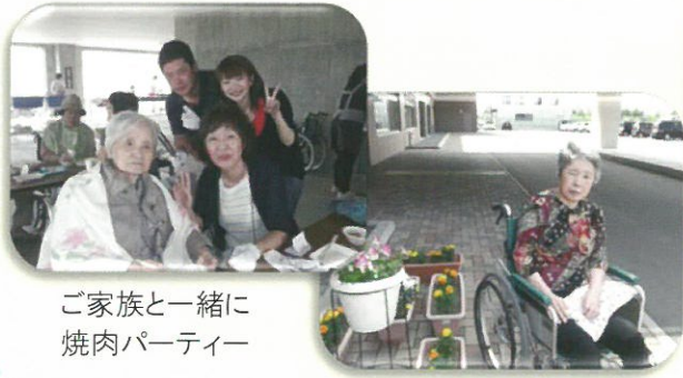
ご家族と一緒に 焼肉パーティー