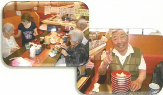
外出行事～回転寿司 楽しい時間を過ごすことができました。