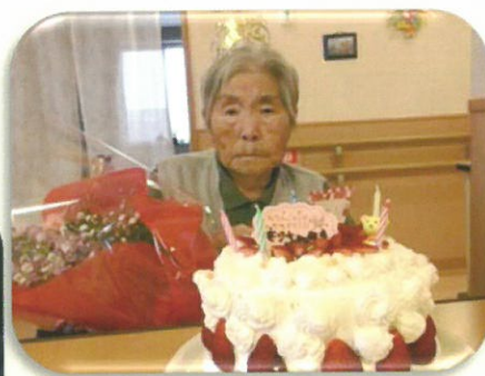
祝 100 回目のお誕生日!!