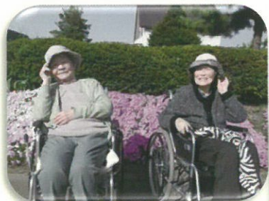
芝桜の前で記念撮影。