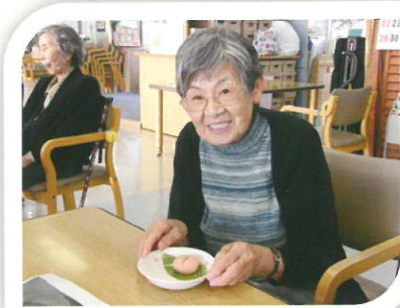
ひな祭りはお菓子作り