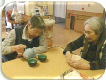
「女子会」毎日開催しています。