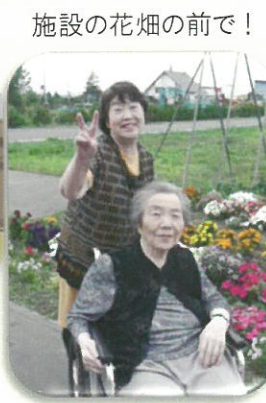
施設の花畑の前で！